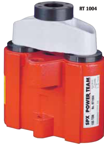
ASME B30.1 700 bar